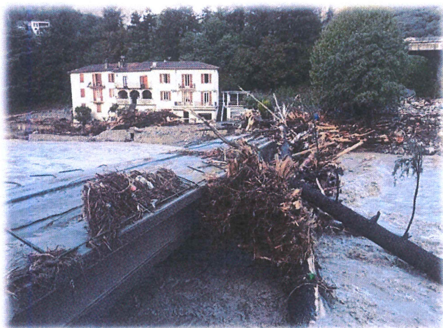
Breil sur Roya Tempête Alex octobre 2020